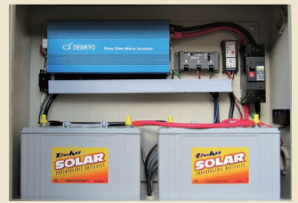
α1500盤内（用途に応じて特注対応）