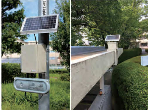
ポール取付けタイプ [SEMI-TALK-A]