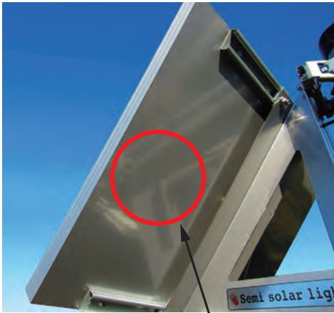
ステンレスプレート