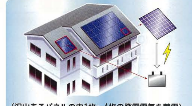
(沢山あるパネルの内1枚~4枚の発電電気を蓄電)