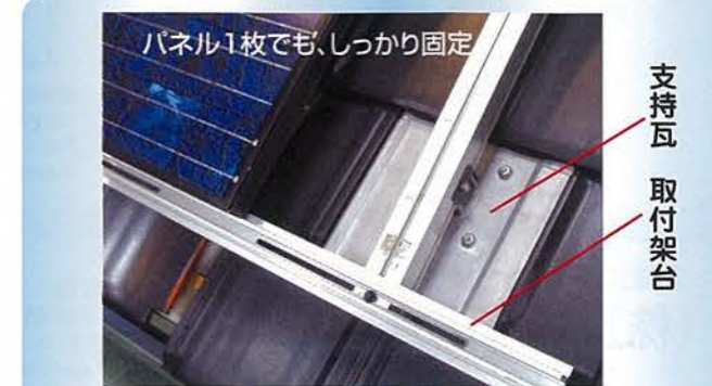
パネル1枚でも、しっかり固定