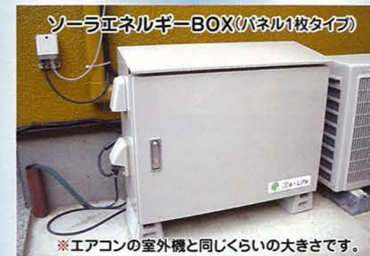
ソーラエネルギーBOX(パネル1枚タイプ)