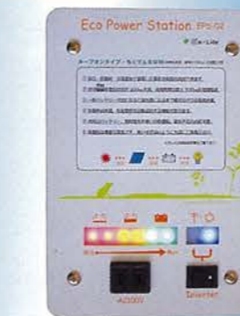
エコパワーステーション (室内設置) 埋込・露出兼用