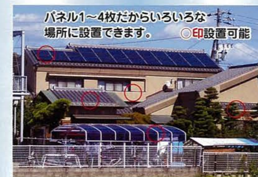
パネル1~4枚だからいろいろな場所に設置できます。◎印設置可能

(注)冷蔵庫、エアコンなどはご使用いただけません。使いたいものがありましたら、お気軽にご相談下さい。