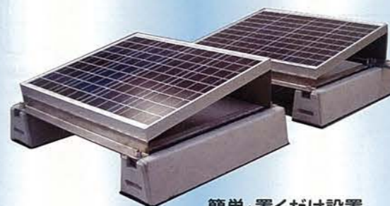
簡単・置くだけ設置